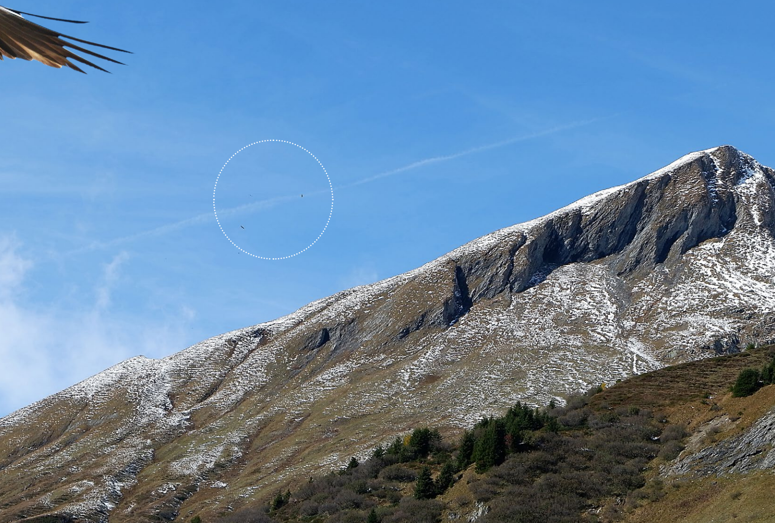
Wer sieht zwei Bartgeier und einen Steinadler? Blick auf die Felsen des Auswilderungsortes 2010–2014 kurz nach 13 Uhr.

trübt selten Nebel die Sicht und der Schnee bildet einen guten Kontrast zum überwiegend dunklen Gefieder der Bartgeier. Wir beobachten die Vögel dabei, wie sie sich von der aufsteigenden warmen Luft in die Höhe tragen lassen und daraufhin die Berghänge entlang gleiten – dabei nutzen sie kaum einen Flügelschlag. „Bartgeier fliegen eher tief“, ist ein weiterer Hinweis von ihr.