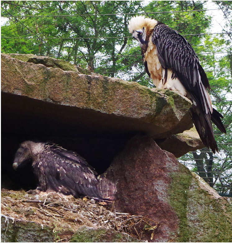
Jungvogel in Horst der Bartgeiervoliere am Berg im Tierpark Berlin.